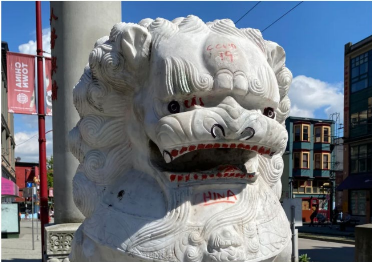
Racist graffiti seen on the lions at the base of the Millennium Gate in Vancouver's Chinatown. Sarah Ling

Posted May 20, 2020 6:55 pm · Updated May 20, 2020 8:38 pm